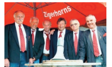
Das Sextett – die Ziger Horns ☀

So ist es nur logisch, dass die Band homogen und professionell auftritt, Swing, Drive und Groove – eine fetzende Musik – das sind die Qualitäten, die ihre Anhänger stets aufs Neue begeistern. In Ihrer Heimat, dem Glarnerland sind die ZIGER HORNS eine feste Grösse, kaum ein grösserer Anlass geht über die Bühne ohne ihr Mittun. Seit der dreiwöchigen Tournee in Australien 1993 sind sie selbst international bekannt. Am Samstag, 9. August 2014 ab 18.30 Uhr gehört die Bühne den Ziger Horns.