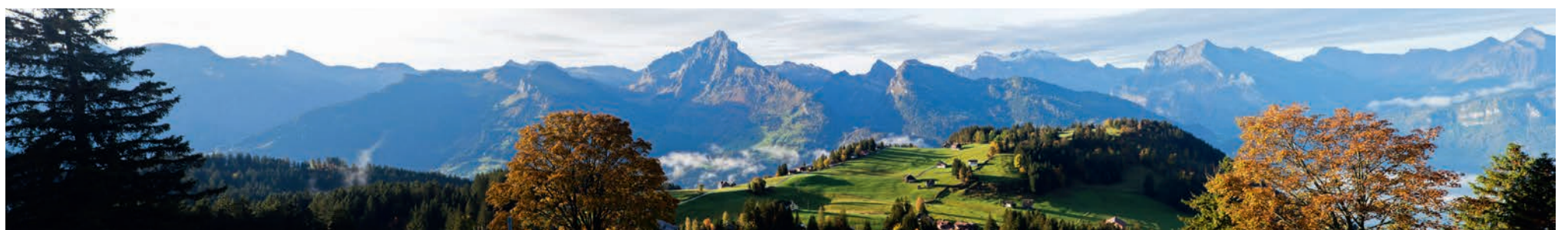
Herbstlich bunt – Blick auf das traumhafte Panorama der Glarner und St.Galler Alpen. Direkt vor dem Hotel beginnt das grosse Wandergebiet. Über 100 km markierte und gepflegte Wanderwege befinden sich auf gemeindeeigenem Boden. Wanderwege gibt es in allen Schwierigkeitsgraden und auch das Toggenburg ist gut erschlossen. Eine Wanderung an den Walensee lässt sich problemlos mit einer Schifffahrt kombinieren und das kühle Nass bringt immer eine Erfrischung.