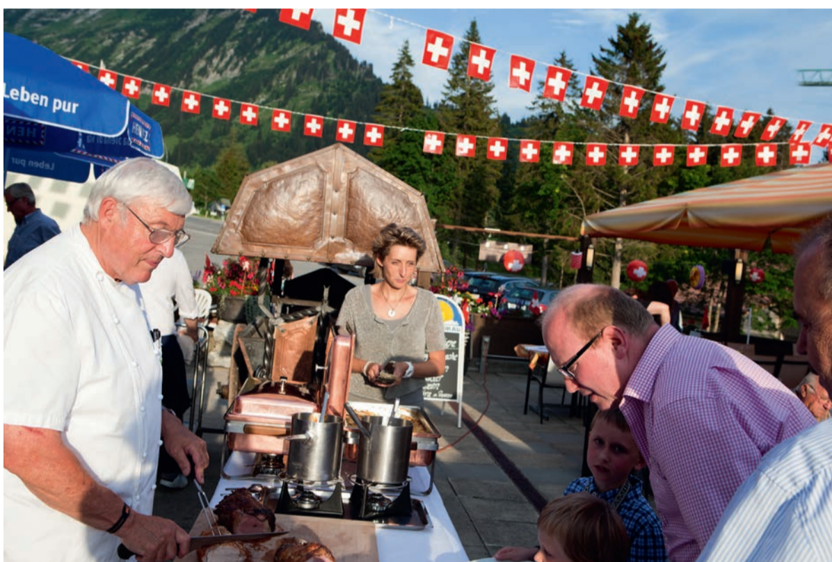
Ein Ort der Idylle – am Ende der Hauptstrasse, fern ab von Stress und Hektik, umgeben von einem herrlichen Bergpanorama und grünen Weiden. Hier ist die Welt noch in Ordnung und hier lassen sich Feste aller Art feiern. Bei der 1. August Feier werden verschiedene Braten vom Holzkohलगrill zu einem grossen Salatbüffet angeboten. Was passt besser zur Unterhaltung am Nationalfeiertag als echte Schweizer Musik?

Jeden zweiten und vierten Donnerstag im Monat schlagen die Herzen der Harley Davidson-, Victory-, Triumph-, Honda- oder Kawasaki-Fahrer höher. Die spannende, kurvenreiche Strecke von Weesen nach Amden/Arvenbüel lockt viele Motorradfahrer zu einer Ausfahrt.