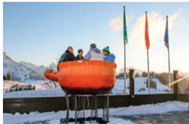
Fondue-Plausch für bis 6 Personen in luftiger Höhe und unter freiem Himmel. Ein einmaliges Erlebnis mit einem traumhaften Panoramablick.

Die Idee, im Caqelon ein Fondue zu geniessen, entstand schon vor mehreren Jahren. Es sollte ein Werbe-Gag werden. Das aus Polyester gefertigte Caqelon wurde vom Seniorchef und seinem Schwiegersohn persönlich gebaut. Letztlich war der Aufwand für den Innenausbau aber viel grösser als gedacht. So ruhte das Caqelon Winter für Winter auf der Terrasse und wurde im Sommer hinter dem Haus verstaut. „Wie oft sagten wir uns; jetzt müssen wir dann doch mal den Innenausbau fertig machen“ erzählt die Seniorchefin Silvia Rüedi.