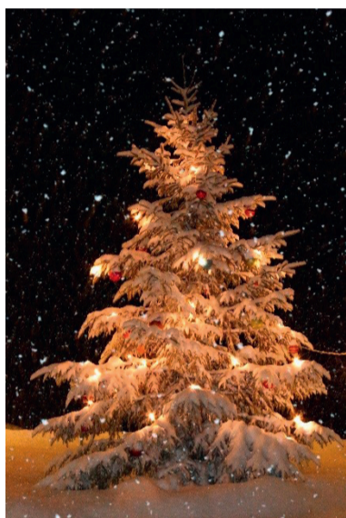
Weihnächtliche Stimmung drinnen und draussen im Hotel Restaurant Arvenbüel. Die Festtage in gemütlicher Stimmung geniessen und das Jahr bei einer tollen Feier ausklingen lassen.

Gemütlichkeit, Genuss, Atmosphäre, Freundlichkeit und Wohlergehen sind nur einige Schlagwörter, die bei einem Aufenthalt im Hotel Restaurant Arvenbüel erlebt werden können. Die Küchencrew zaubert immer wieder aufs Neue hervorragende Köstlichkeiten. Das gediegene Weihnachtsmenü und das festliche Silvestermenü sind die bevorstehenden Highlights.