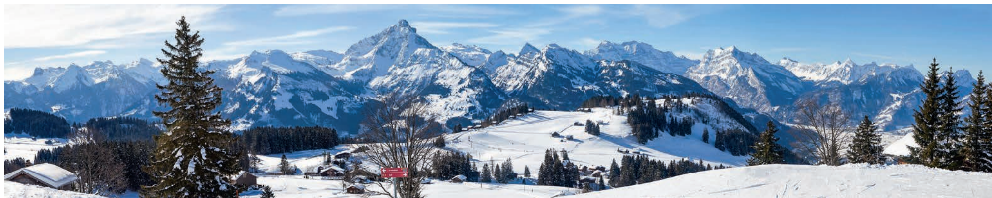
Blick von der Bergstation Sell auf das traumhafte Panorama der Glarner und St. Galler Alpen. Direkt vom Hotel Restaurant Arvenbuel sind die Skipisten, die Winterwanderwege, die Langlaufloipe, die Kinderskischule und das Natureisfeld erreichbar. Links im Hintergrund ist die Skiregion Flumserberg. In nur 20 Minuten erreicht man von Amden die Talstation der Gondelbahn Tannenbodenalp, die direkt mitten ins Skigebiet führt.