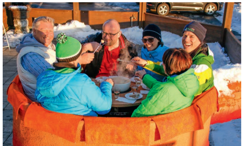
Das Riesen-Caqelon bietet Platz für bis 6 Personen. Mit Freunden und Familien macht es nicht nur viel Spass, sondern lässt einen für ein paar Stunden den Alltag vergessen. Gemütlichkeit und Unbeschwertheit gehören ebenso zu diesem Erlebnis, wie ein feines Fondue, ein Gläschen Wein, ein Kafi Schnaps und das atemberaubende Bergpanorama. In luftiger Höhe, unter freiem Himmel und mit der frischen Luft ist dieser Fondue-Plausch unbestritten ein einmaliges Erlebnis, das man sich nicht entgehen lassen sollte.

Dieser Fondue-Plausch eignet sich hervorragend als Geschenk. Schenken Sie Ihren Freunden und Familien nicht nur ein Erlebnis der besonderen Art. Schenken Sie ihnen Ihre Zeit. Das kostbarste Gut für uns Menschen ist, nebst einer guten Gesundheit, die Zeit. Ein paar Stunden zusammen sein, ein leckeres Fondue essen, auf die Gesundheit anstossen, Gemüt-